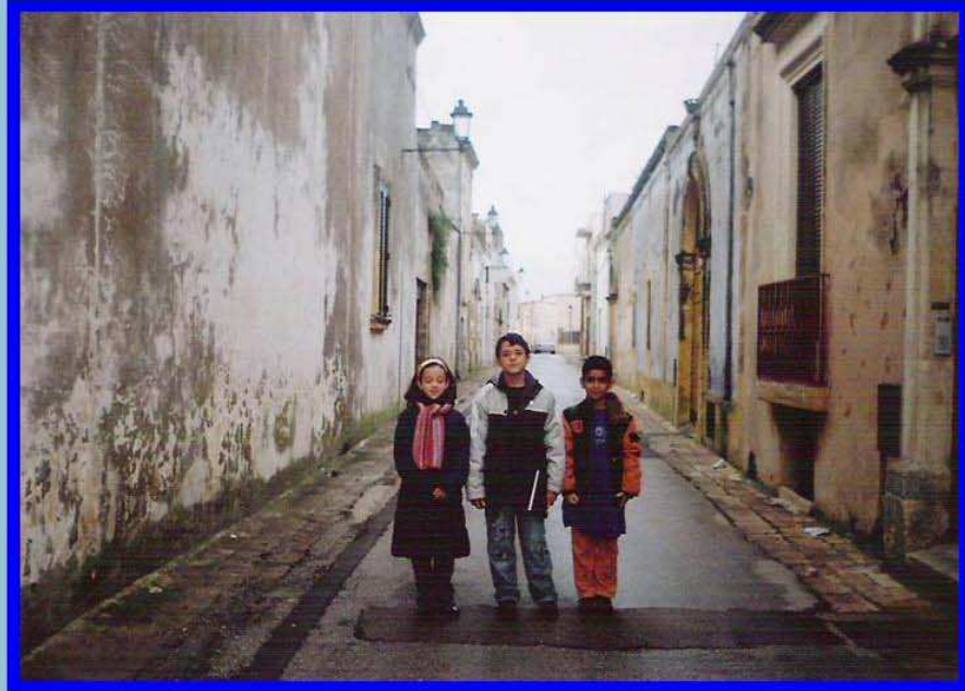
VIA IV NOVEMBRE

Intitolata alla festività delle forze armate che celebra la memoria dei caduti di tutte le guerre. In questo giorno si ricordano i soldati che hanno lottato per liberare l'Italia dai nemici durante le due guerre mondiali.