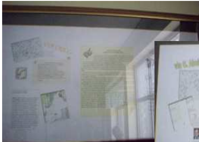
Via B. Craxi