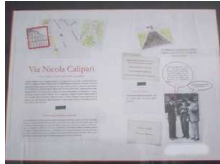
Via Nicola Calipari