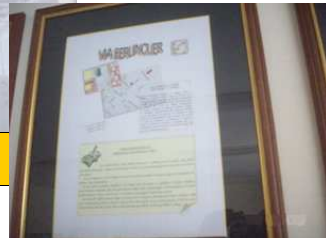
Via E. Berlinguer