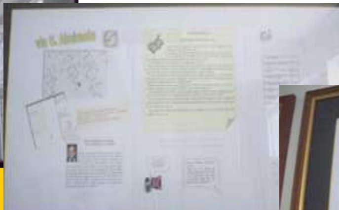
Via G. Almirante