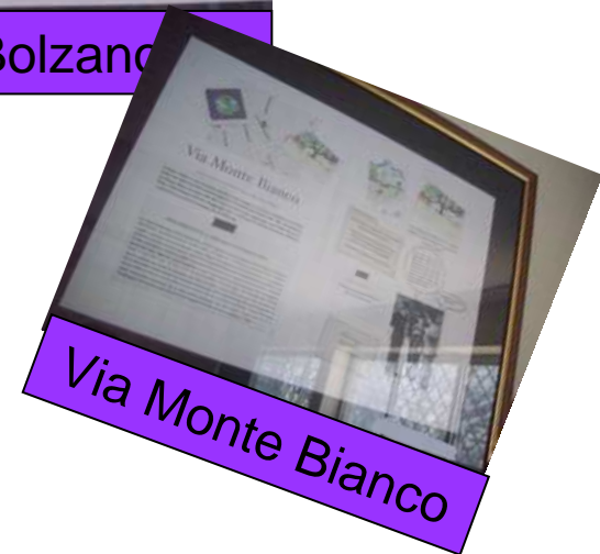
Via Monte Bianco