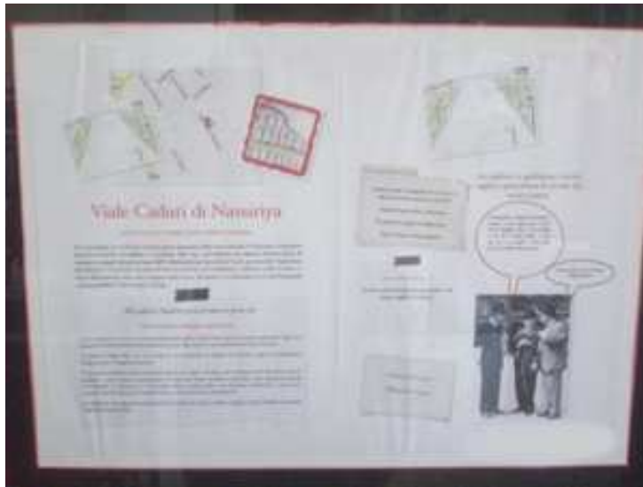
Viale Caduti di Nassirya